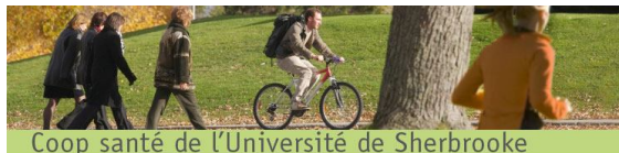
Coop santé de l'Université de Sherbrooke

La Coop santé de l'UdeS vous invite à un colloque sur la prévention et la promotion de la santé, le lundi 3 novembre au Campus de la santé. En avant-midi, les participantes et les participants à une mission d'études canadienne au Japon amèneront des idées inspirantes pour améliorer l'approche en santé au Québec et au Canada. En après-midi, la Coop santé présentera son expérience avant-gardiste qui va dans le même sens.